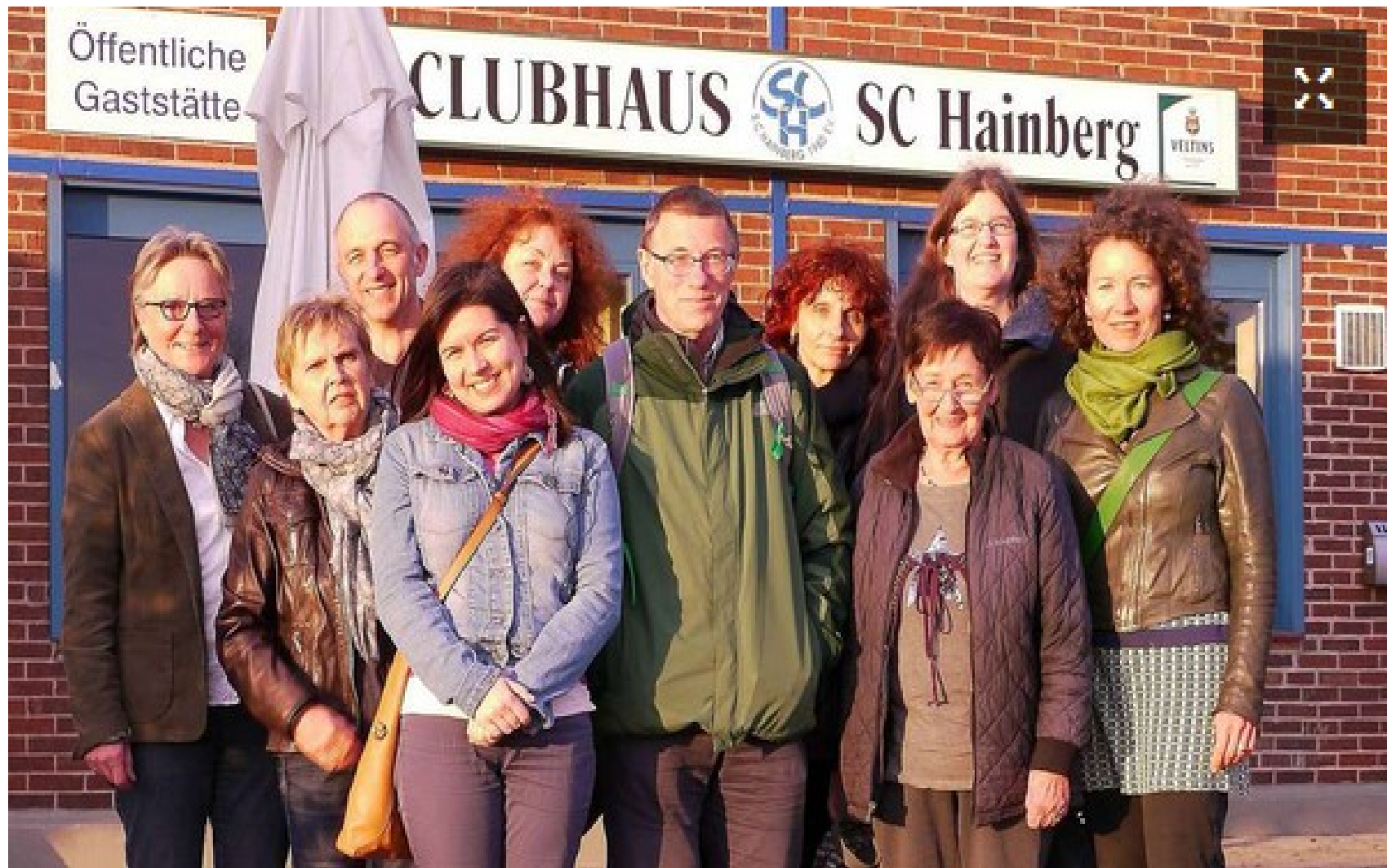
Treffen RTZ im Mai 2015